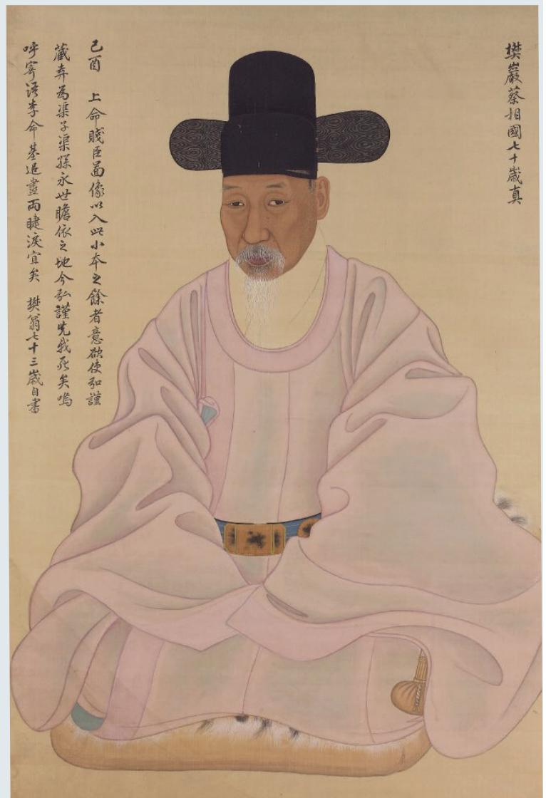
Yi Myeong-gi (ca. 1760–ca. 1820) Portrait of Chae Jegong Joseon-Dynastie, datiert 1789 Hängerolle, Tusche und Farbe auf Seide